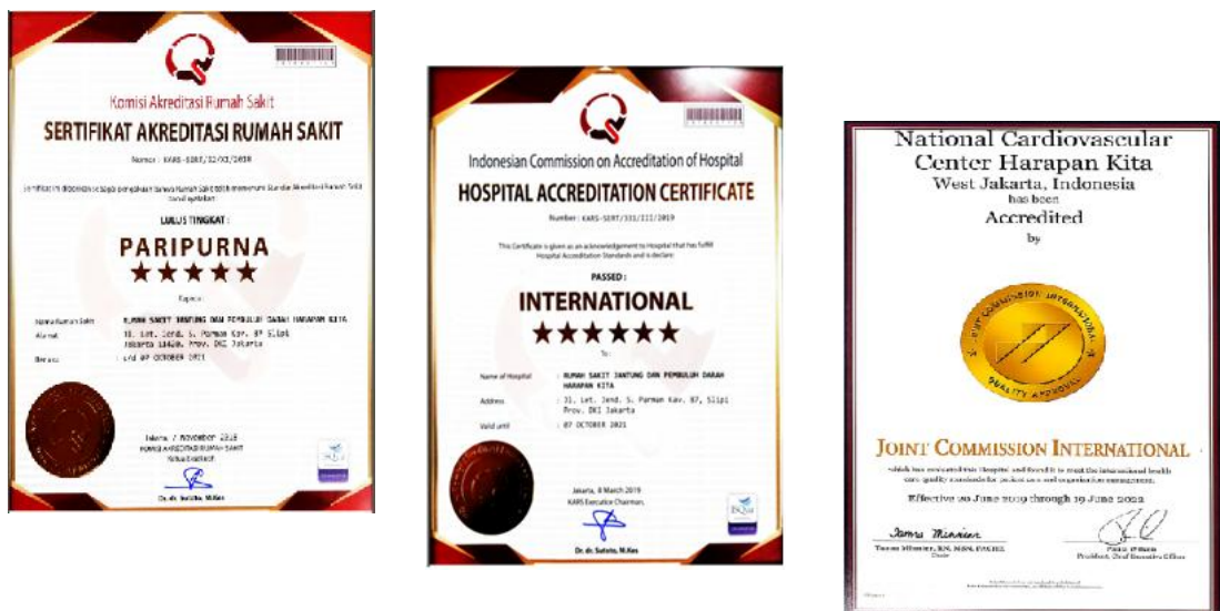
Gambar 2.1. Sertifikat Akreditasi

Pada tahun yang sama RSJPDHK Lulus Joint Commission International (JCI) pada tanggal 20 Juni 2019.